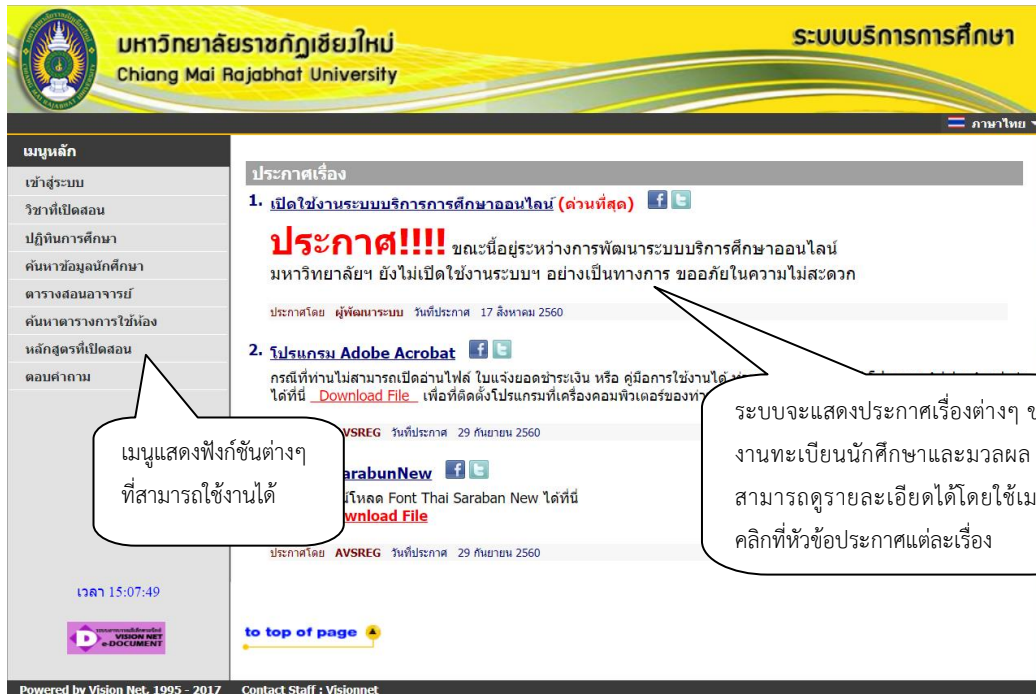
รูปที่ 1 หน้าจอแรกเมื่อเข้าสู่ระบบ

นักศึกษาสามารถใช้งานระบบบริการการศึกษาออนไลน์ได้จากเครื่องคอมพิวเตอร์ทุกเครื่องที่เชื่อมต่ออยู่กับระบบเครือข่ายของมหาวิทยาลัย และ/หรือ เครือข่ายอินเทอร์เน็ต โดยการกำหนด Location หรือ Net site ในโปรแกรม Internet Explorer ไปที่ URL ที่ทางมหาวิทยาลัยฯ กำหนด แล้วกดปุ่ม Enter ระบบจะนำนักศึกษาไปสู่ข้อมูลพื้นฐานทั่วไป ซึ่งทุกคนสามารถใช้งานได้ดังจอภาพต่อไปนี้